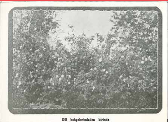
Gül bahçelerimizden birinde

Hidirellez kutlamalarının gerçek sebebi kışın sona ermesi ve de tabiatın canlanmasıdır. Hidirellez'de yaşlılar yeni bir yıla erişmenin, yetişkinler geçimleri için gerekli olan bolluk ve berekete kavuşmanın, gençler ve çocuklar da eğlenmenin tadını çıkarırlar.